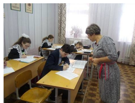
открытый урок по химии